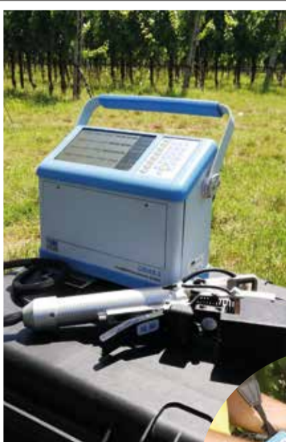
FIGURA 4 Esempio di analizzatore portatile di scambi gassosi fogliari.

I campioni di foglie selezionati vengono investiti da una radiazione luminosa generata dallo strumento, la componente di luce riflessa viene misurata dallo spettrofotometro (Figura 2) e i rispettivi spettri (caratteristici della matrice analizzata, ovvero l'impronta ottica della foglia di vite) vengono visualizzati sullo schermo e al tempo stesso registrati dal software di gestione dedicato. Il range di lunghezze d'onda nella regione del NIR è di particolare interesse per la stima del potenziale fogliare e quindi per il monitoraggio dello stato idrico della vite, perché comprende la regione (intorno