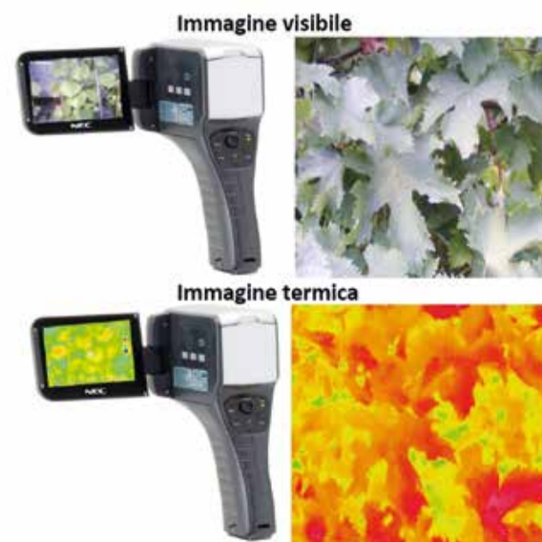
FIGURA 6 Applicazione della termografia IR mediante termocamera.